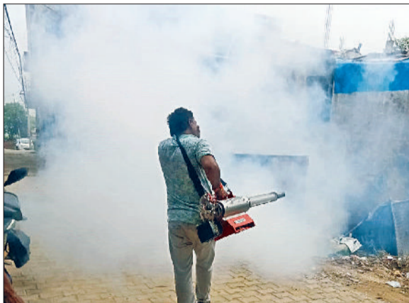
रेवाड़ी। उत्तम नगर में फोंगिंग करता कर्मचारी, सेक्टर-4 में फोंगिंग करता कर्मचारी,

मानसून सीजन में बढ़ते डेंगू के मामले ने स्वास्थ्य विभाग को चिंता में डाल दिया है। बरसात से जलभराव के कारण मच्छरों की संख्या बढ़ने से डेंगू व मलेरिया बीमारियों का भी खतरा बढ़ गया है। अगस्त माह में डेंगू के मामले लगातार बढ़ते जा रहे हैं। आगामी सितंबर माह में डेंगू से निपटना स्वास्थ्य विभाग के लिए चुनौती रहेगी, हालांकि स्वास्थ्य विभाग डेंगू व मलेरिया के की रोकथाम के लिए प्रयास कर रहा है। राहत की खबर यह है कि सोमवार से नगर परिषद की ओर से भी वार्डों में फोंगिंग का कार्य शुरू कर दिया गया है, जिससे मच्छरों के प्रकोप से राहत मिलेगी। जिले में अब तक डेंगू के 60 व मलेरिया के 11 केस मिल चुके हैं।