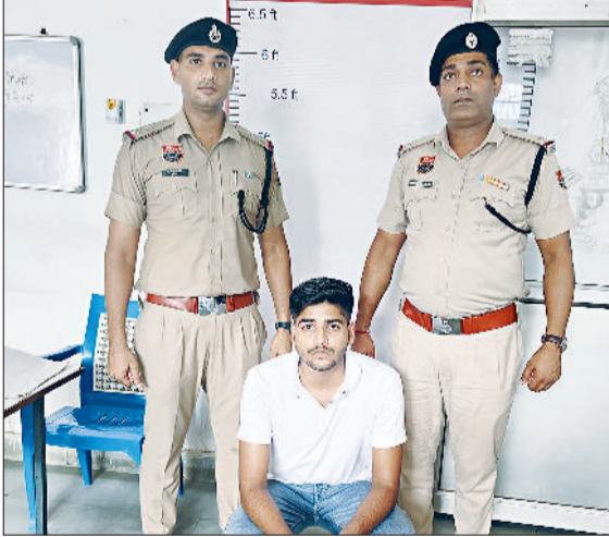
रेवाड़ी। पुलिस गिरफ्त में आरोपी।