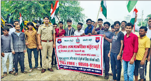
रेवाड़ी। ग्रामीणों को नशे के खिलाफ जागरूक करती एनसीबी टीम।

हरियाणा स्टेट नारकोटिक्स कंट्रोल ब्यूरो की ओर से प्रदेश में नशा तस्करो के खिलाफ सख्त कानूनी कार्रवाई की जा रही है। साथ ही आम लोगों को जागरूक करने के लिए अभियान चलाए जा रहे हैं। नशा आज सिर्फ एक लत नहीं, बल्कि समाज को दीमक की तरह खोखला कर रहा है। गांवों की गलियों से लेकर घर-आंगन तक इसकी जड़ें फैल चुकी हैं, जिससे युवा पीढ़ी सबसे ज्यादा प्रभावित हो रही है। एनसीबी जिला यूनिट की ओर से सोमवार को गांव साल्हावास और ढालियावास में जागरूकता अभियान चलाकर लोगों को नशे के