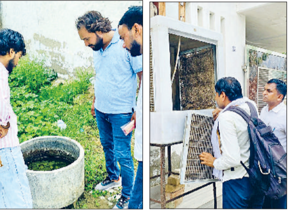
रेवाड़ी। कूलर में लार्वा की जांच करते स्वास्थ्य कर्मी।