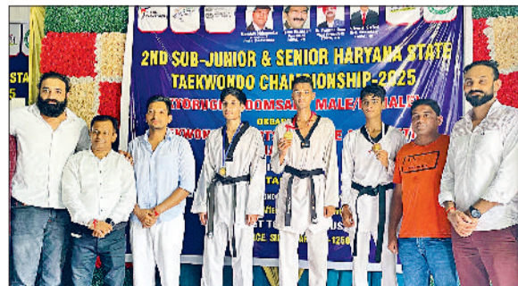
रेवाड़ी। मेडल विजेता खिलाड़ी आयोजकों के साथ।