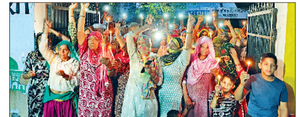
रेवाड़ी। रामगढ़ में कैंडल मार्च निकालती महिलाएं।