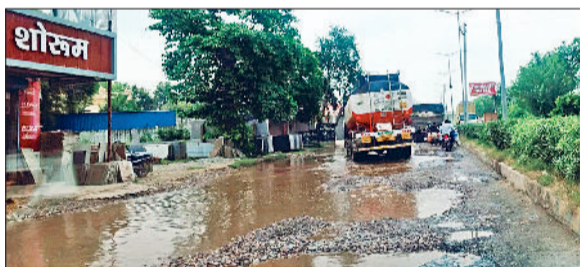
रेवाड़ी। गढ़ी बोलनी रोड की खस्ताहाल हालत तथा कसोला चौक पर सड़क पर हुआ गड़ब।