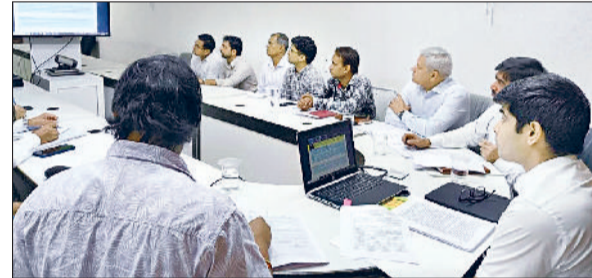
रेवाड़ी। नमस्ते योजना के तहत अधिकारियों की बैठक लेते डीसी अभिषेक मीणा।

डीसी अभिषेक मीणा ने कहा कि सफाई कर्मचारियों को बीमारियों से बचाने के लिए सभी स्वच्छता कार्यों को सुरक्षा उपकरणों और कुशल श्रमिकों के माध्यम से कराया जाए। सफाई कर्मचारियों को व्यावसायिक सुरक्षा प्रशिक्षण दिलाकर उनको स्वरोजगार में सक्षम बनाना भी प्रशासन का उद्देश्य है। डीसी अभिषेक मीणा सोमवार को लघु सचिवालय सभागार में सीवर सफाई और अन्य सफाई से संबंधित सभी संबंधित विभागों के अधिकारियों के साथ बैठक आयोजित कर संबंधित विभागों को व्यापक दिशा-निर्देश दे रहे थे। बैठक से पहले जन स्वास्थ्य अभियांत्रिकी विभाग के आयुक्त एवं सचिव मोहम्मद शाइन में