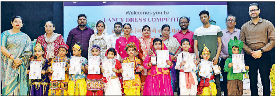
रेवाड़ी। प्रतियोगिता के विजेता प्रतिभागी अतिथियों व शिक्षकों के साथ।