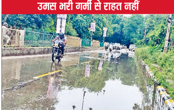
रेवाड़ी। सोमवार सुबह आई बरसात से अनाजमंडी रोड पर जमा पानी।

अधिकतम तापमान 0.5 डिग्री सेल्सियस की कमी के साथ 34 डिग्री पर आ गया। न्यूनतम तापमान 0.6 डिग्री की कमी के साथ 22.6 डिग्री सेल्सियस दर्ज किया गया। हवा में नमी का स्तर 76 फीसदी रहा, जबकि 11 किमी प्रति घंटा की रफ्तार से हवाएं चलतीं। अलग-अलग ब्लॉक में औसत 2 से 10 एमएम तक बारिश हुई। बारिश के बाद तेज धूप निकलते ही उमस भरी गर्मी ने लोगों के जमकर पसीने निकालने का काम किया। हवा में नमी के कारण चिपचिपाहट भरी गर्मी ने खूब बेहाल किया। मौसम विभाग के अनुसार 19 अगस्त को भी आसमान में बादलों के बीच बिखराव में बारिश हो