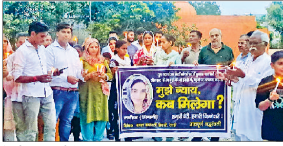
रेवाड़ी। कंकरवाली में कैंडल मार्च निकालते हुए नागरिक।

मिवानी में महिला अध्यापक की हत्या के विरोध में लोगों का आक्रोश लगातार बढ़ता जा रहा है। शिक्षकों, स्थानीय नागरिकों और दा पावर ऑफ ह्यूमन राइट्स फाउंडेशन के सदस्यों ने कंकरवाली स्थित अंबेडकर पार्क से शिव मंदिर तक कैंडल मार्च निकालकर प्रशासन के खिलाफ नाराजगी जताई। लोगों ने आरोप लगाया कि पुलिस और प्रशासन की लापरवाही के चलते अब तक न तो दोषियों पर कार्रवाई हुई है और न ही पीड़ित परिवार को न्याय मिल पाया है। उन्होंने चेतावनी देते हुए कहा कि यदि जल्द ही दोषियों को गिरफ्तार कर कड़ी सजा नहीं दी गई तो